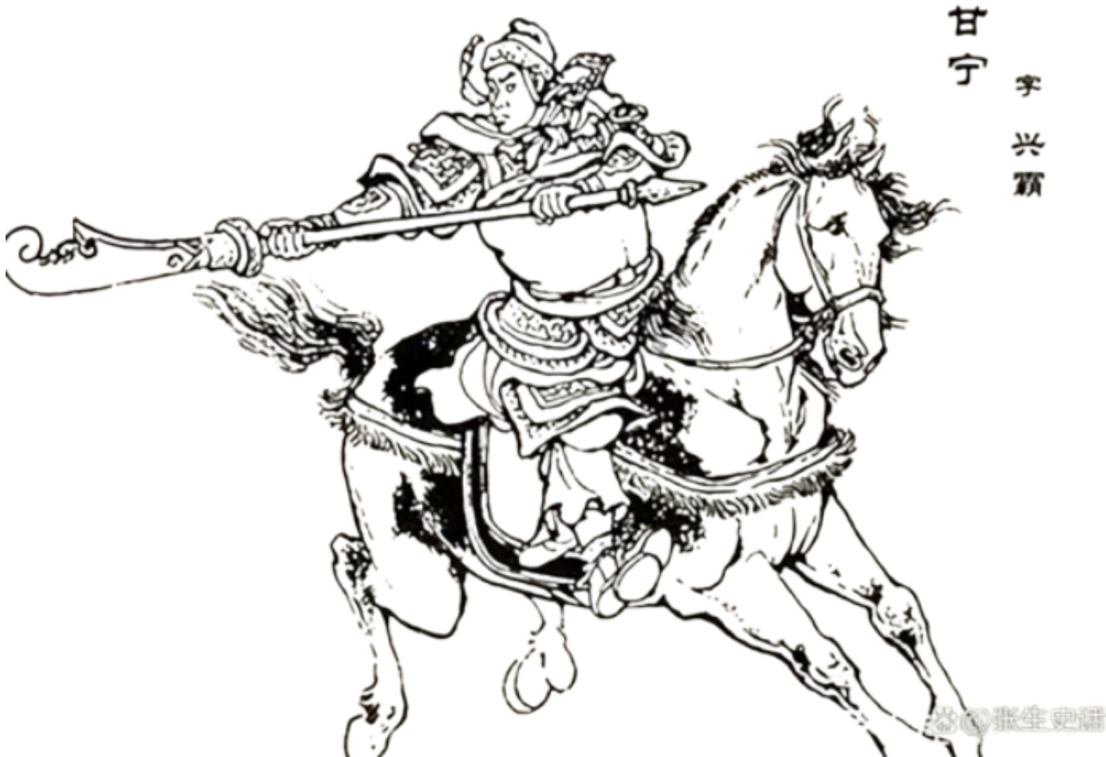
甘 宁 李 兴 霸