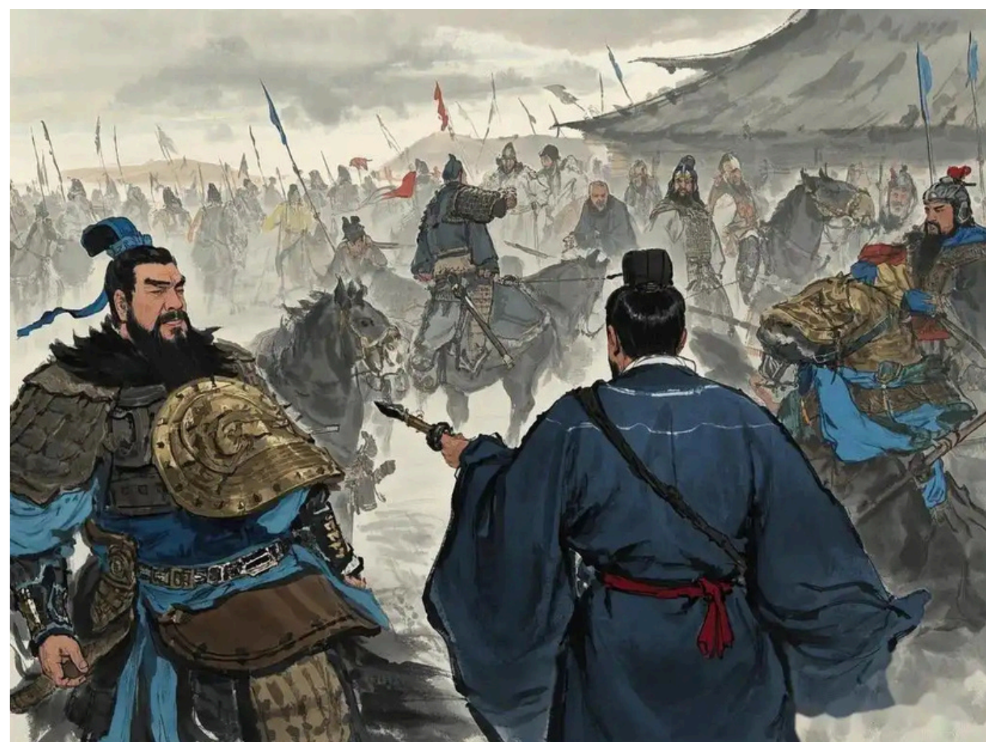
▲『衆寡敵せず』

四字熟語です。「衆寡敵せず」とは戦争で人数が少ない側は多いほうにかなわないことです。この四字熟語は『孟子・梁惠王上』の「寡は衆に敵すべからず」から出たものです。軍事的対抗や勢力間の博奕を背景とした場面で多く使われます。『三国演义』第15回に「王朗は衆寡敵せず」という戦場の描写が書かれています。