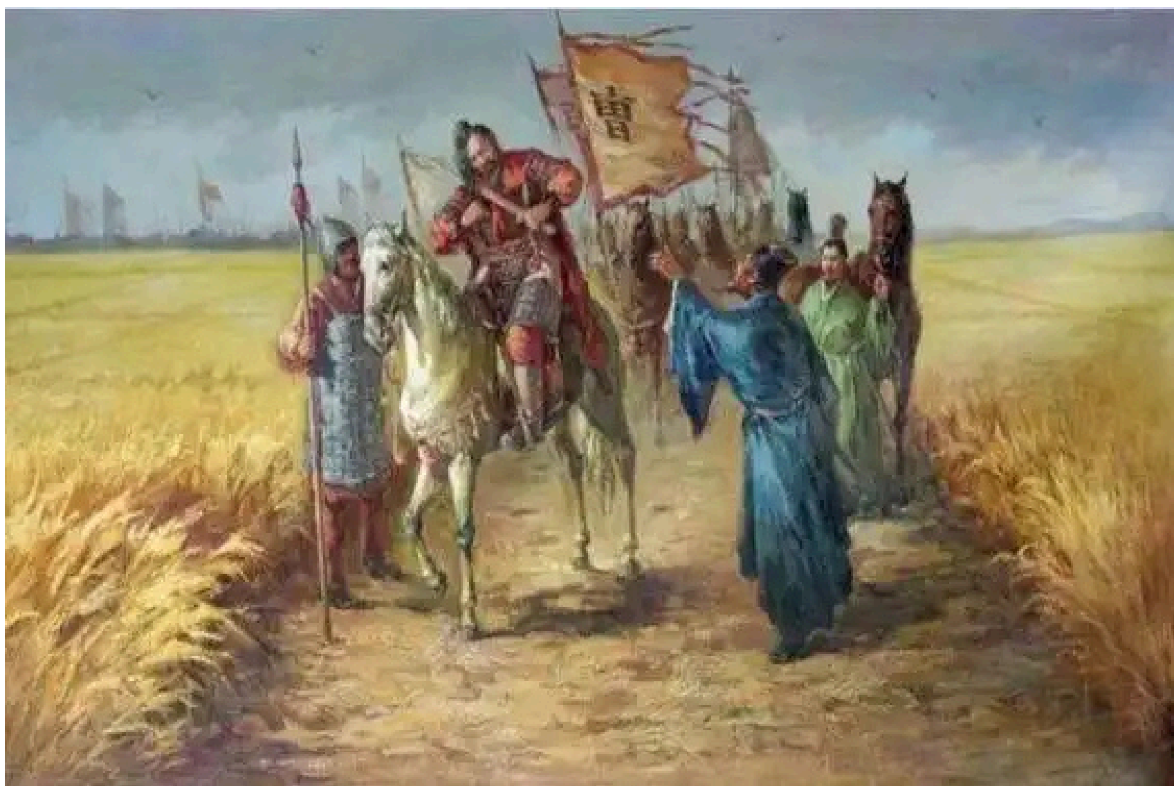
▲『首切りの代わりに髪を切る』

这则成语字面意思是把头发割了代替砍头。古人讲究身体发肤受之父母不可毁伤，割发可以算是不孝之大罪，所以曹操就在军前割发代首以明军纪。