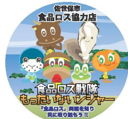
協力店配布用ステッカー