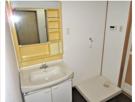
洗面・洗濯機置場