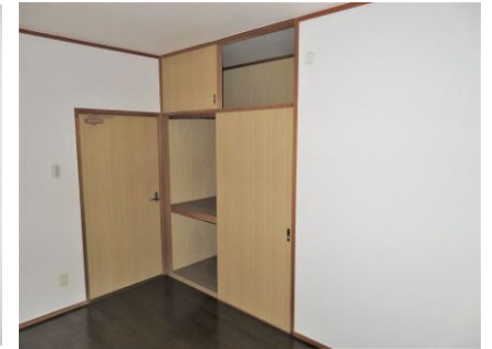
玄関横 洋室 (6畳)