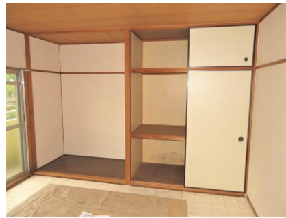
LDK横 和室 (6畳)