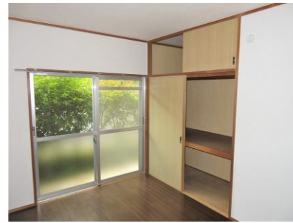
玄関右奥 洋室 (6畳)