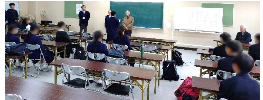
中学校の部 閉講式

本市における魁として平成29年度から始まった未来塾も、今回で9年が経ちました。始まった年に小学校に入学した子が、今年は中学校卒業=小1から未来塾に参加していれば、9年間学んだということになりますが、残念ながら該当者はいませんでした。最長は、小学校3年次から7年間参加した中学3年の男子生徒でした。