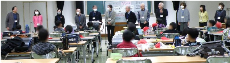
小学校の部 閉講式