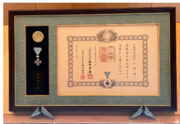
▲瑞宝双光章・勲章