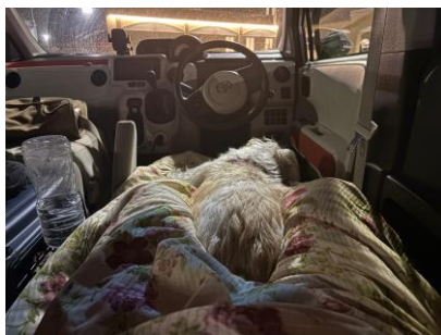
▲カーテンなしの車中泊