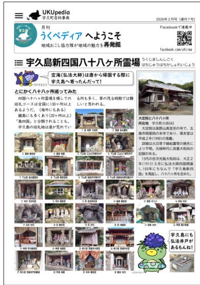
最終号は八十八ヶ所巡り!!