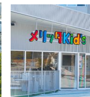
Park-PFIの手法によりリニューアルした中央公園