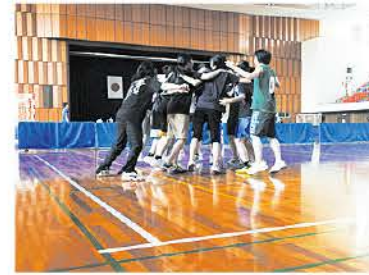
スポーツ大会/歓迎会