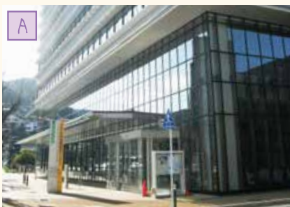
中央保健福祉センター (すこやかプラザ)