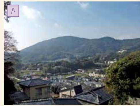
コースからのながめ