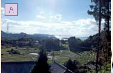
コースからのながめ

● 郵便局 ⊙ 公民館 H 神社 ● バス停 ◆ 距離表示板 (1) 0.5km (2) 1.4km (3) 2.5km (4) 5.9km (5) 6.5km