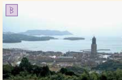
(C) ハウステンボス/J-15899 ハウステンボス 坂をのぼりきったらハウステンボスが一望できます。