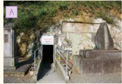
無窮洞 第2次世界大戦中に高等部 (現在の中学生)が掘った防空壕