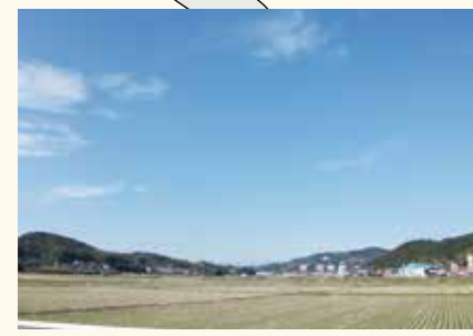
宮地区コースの風景