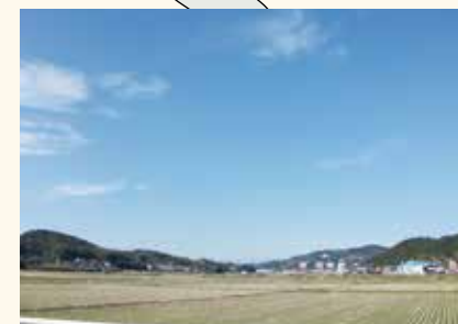
宮地区コースの風景