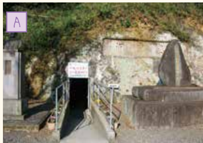
無窮洞 第2次世界大戦中に高等部 (現在の中学生)が掘った防空壕