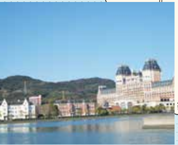
ハウステンボスの見える風景