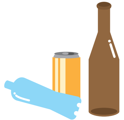
屋外に放置された空きビン・缶・ペットボトル