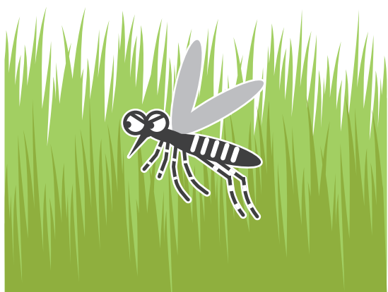
風通しの悪いやぶ・草むら

公園、学校、寺社、空海港、駅などの施設を管理されている方もご協力をお願いします!