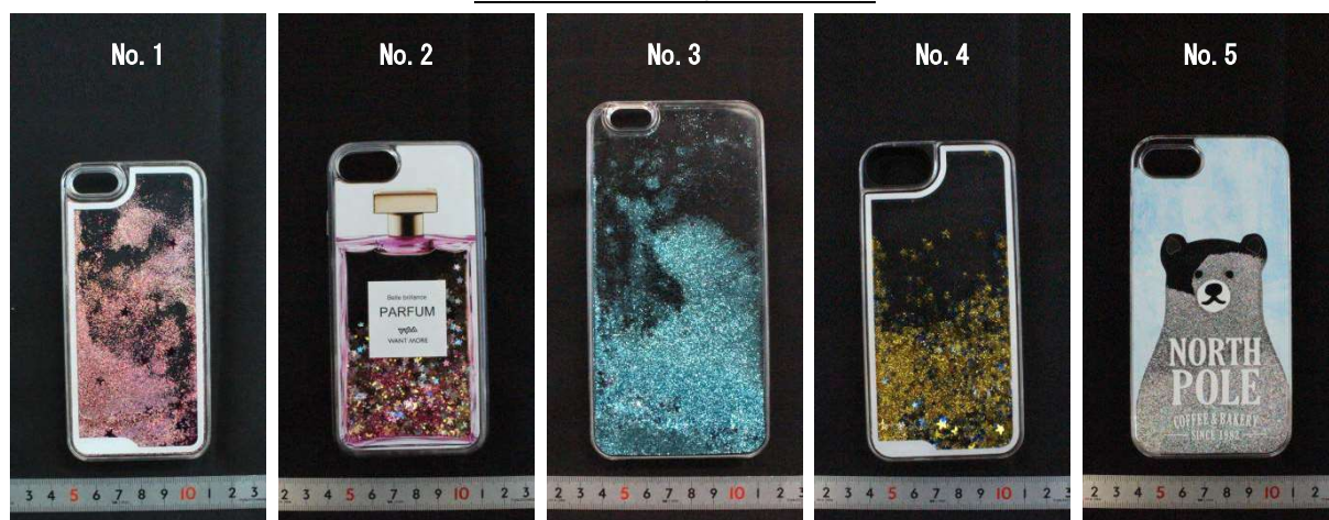
写真. テスト対象銘柄の外観