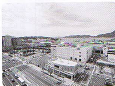
佐世保駅 フレスタSASEBO