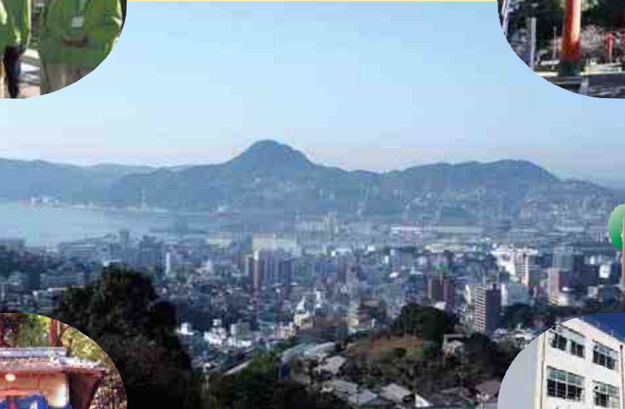
西小佐世保町からの眺望