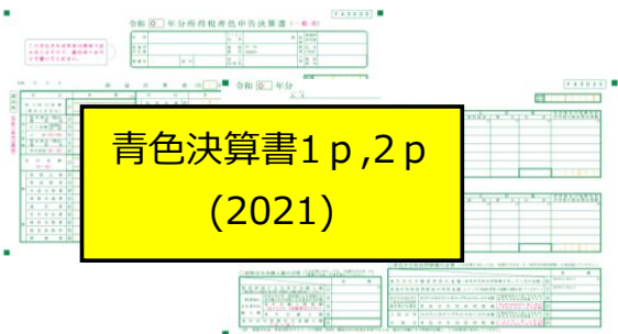
青色決算書1 p, 2 p (2021)