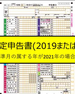
確定申告書(2019または2020) ※基準月の属する年が2021年の場合は不要です