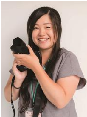
広域圏移住 コーディネーター