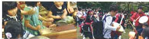
Nagasaki Art Session Orchestra