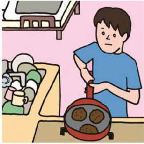
障がいや病気のある家族に代わり、買い物・料理・掃除・洗濯などの家事をしている

本来、大人が担うと想定されている家事や家族の世話などを日常的に行っている子どものことをいいます。