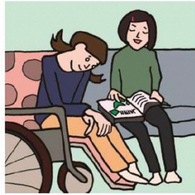
障がいや病気のあるきょうだいの世話や見守りをしている