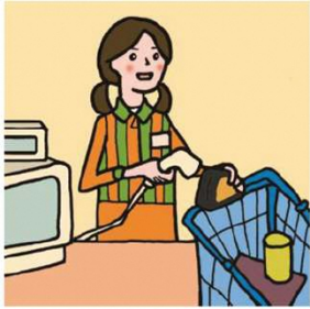
家計を支えるために労働をして、障がいや病気のある家族を助けている