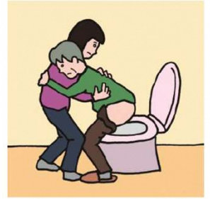
障がいや病気のある家族の入浴やトイレの介助をしている

©一般社団法人日本ケアラー連盟 / illustration : Izumi Shiga