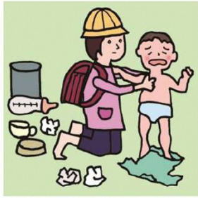
家族に代わり、幼いきょうだいの世話をしている