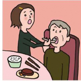
障がいや病気のある家族の身の回りの世話をしている