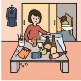
アルコール・薬物・ギャンブル問題を抱える家族に対応している