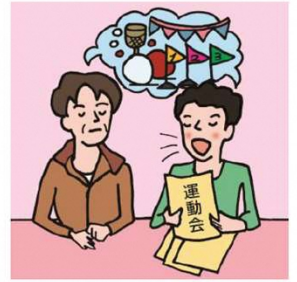
日本語が第一言語でない家族や障がいのある家族のために通訳をしている