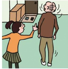
目を離せない家族の見守りや声かけなどの気づかいをしている