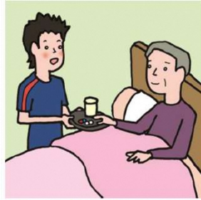
がん・難病・精神疾患など慢性的な病気の家族の看病をしている