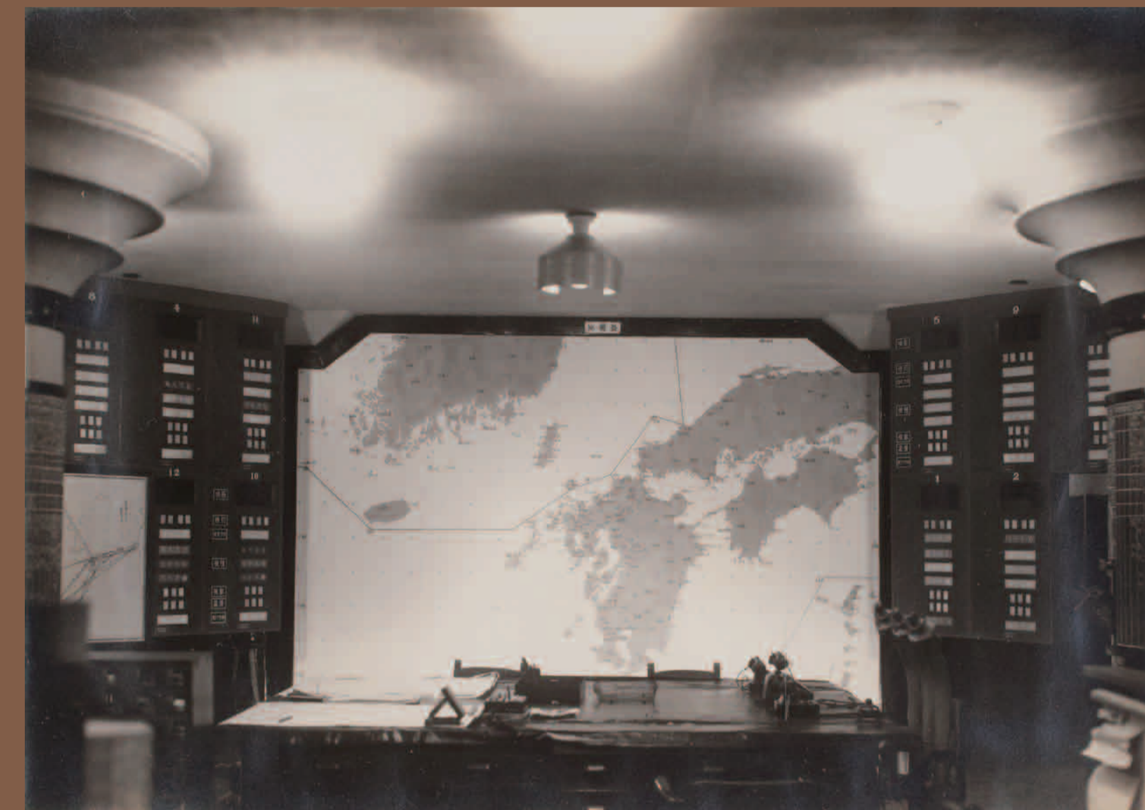
防衛省 防衛研究所蔵『昭和17年12月 佐世保鎮守府戦時日誌』より

Airplanes participated in actual fighting for the first time during World War I. The aeronautical technologies rapidly progressed and became a menace to war vessels and cities. Sasebo Naval Station conducted the first air-raid drill in 1924. In around 1935, the construction of anti-aircraft guns batteries got into full swing and a new Air Defense Command Post was built in the basement of the Sasebo Naval Station headquarters building in 1942. It was a two-story facility and its total floor space was 700 square meters. Its main roles were to integrate information from the outlooks around the naval port and to control the anti-aircraft warfare. During the Sasebo Air Raid in June 1945, the headquarters building was burned down, but the underground command post survived. After the Pacific War, the interior was burnt in a suspicious fire, but the underground shelter itself still remains due to its robustness.