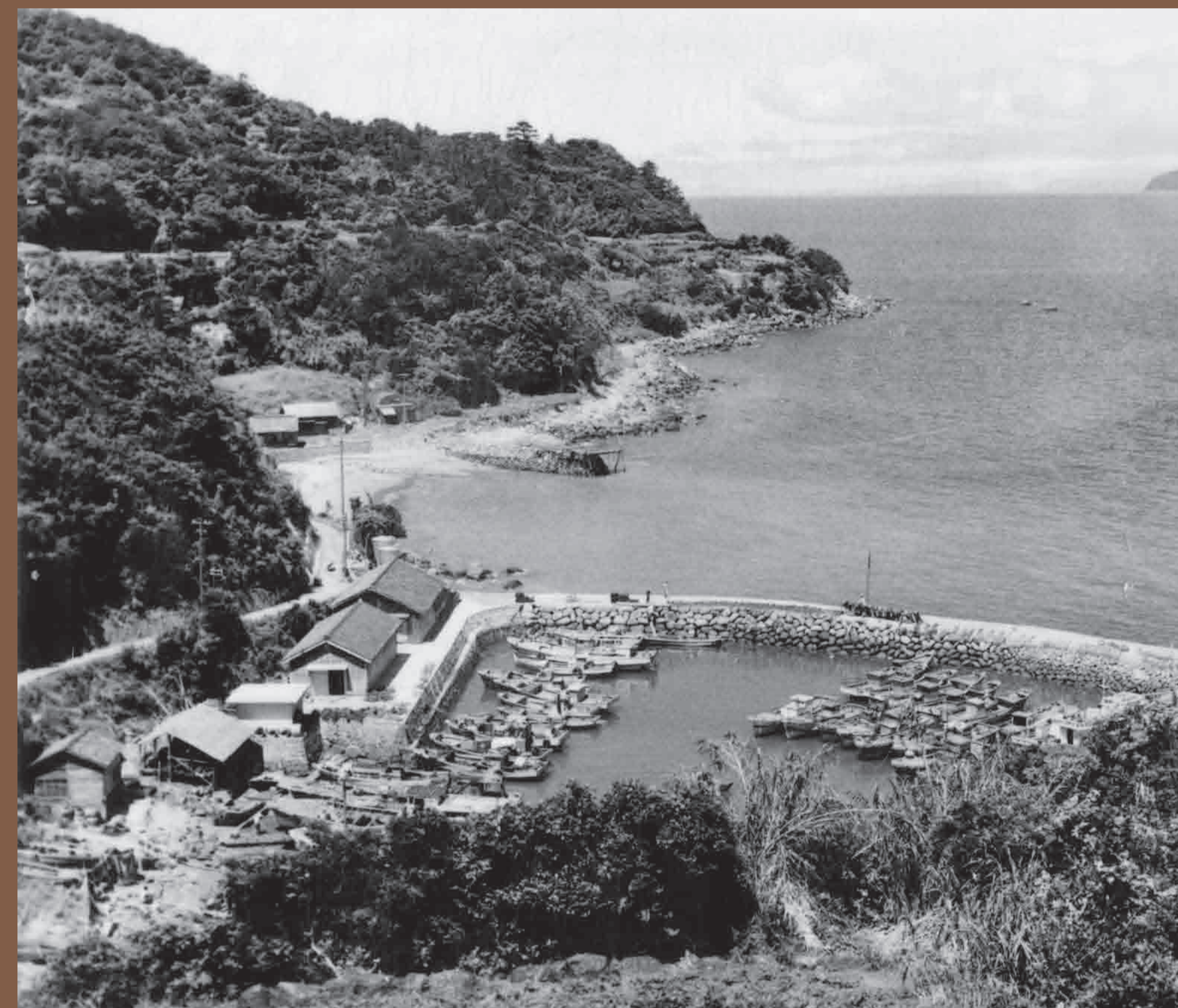
昭和37年(1962)に撮影された黒島港。 画面中央左よりに現役時代の発電所が写っている。

In May 1945, batteries were built at the Nakiri and the Tashiro areas on Kuroshima Island in preparation for the coming decisive battles in mainland Japan. This facility was a power plant to supply the Tashiro battery with electricity. It was a cave-style reinforced-concrete facility with an air-blast-proof wall at the entrance. After the Pacific war, the facility was transferred to the local community and started to supply local people with electricity for the first time in history. As the generator was a water-cooling type, it had an adjoining water tank. It is said children washed their bodies with the tank water after playing in the sea. There is a memorial monument called Sankai-Banrei-To (a tower for all spirits in the three worlds) in the adjacent area, where many human bones which had been found during the construction were buried. Rumor said that they were pirates' bones or ones of Christians who had been executed during the Christianity persecution period.