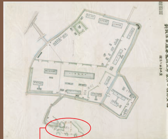
防衛省防衛研究所蔵『明治三十三年公文雑輯巻十八』より

After Sasebo port was designated as a naval port, the Imperial Japanese Army Sasebo Fortress was established in 1900 to defend the port and the surrounding military facilities. Sasebo Fortress Artillery Regiment stationed at the place where Shimizu Junior High School currently stands. At first the Regiment relied on wells for their water, but they soon faced a serious water issue, a chronic shortage of fresh water. Being asked by the Regiment, the Navy started to supply the troop with fresh water after the completion of the first Navy Water Supply Expansion project. And this pond was used as a water purification plant. But the supplied water was only 27 tons per day, so the Regiment started working on the Japanese Government along with Sasebo Naval Station and Sasebo City to expand the well-maintained water supply system in the Sasebo area. There used to be a castle on this hill called Hanaguri Castle built by Endo Tajima-no-Kami, the ruler of the Sasebo area during the period of the warring states (around the 16th century). Also on the hill was a light training battery for the Regiment.