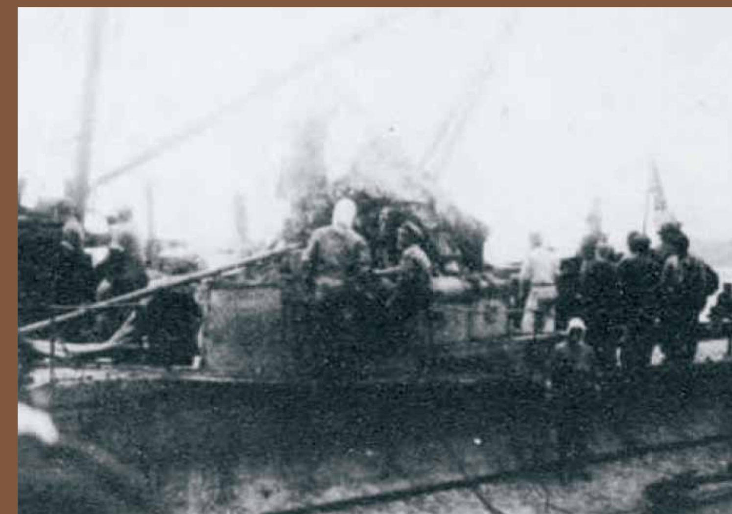
引き上げられた第43潜水艦

衝突の衝撃で艦橋がひしゃげている。第43潜水艦は大正10年(1921)佐世保海軍工廠にて竣工。事故後修理され、呂号第25潜水艦として再就役した。昭和11年(1936)除籍。