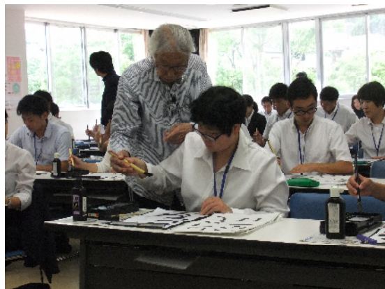
<書写・書道研修の様子>