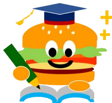
<佐世保学び【場】バーガー>