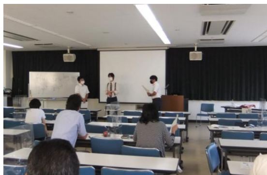
<課題研修（外国語）の様子>