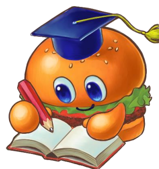
<佐世保学び【場】バーガー>