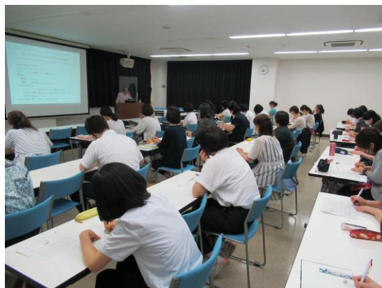
<授業改善研修（外国語）の様子>