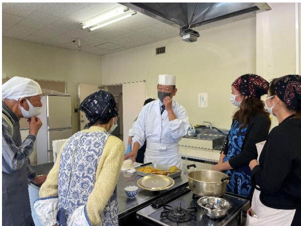
主催講座「常備菜づくり講座」