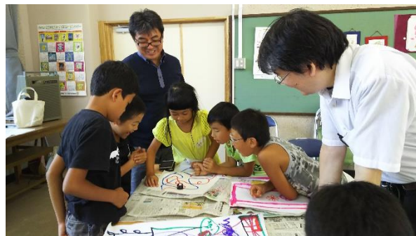
主催講座「サマースクール」