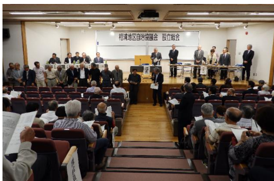
【10月11日 設立総会写真】