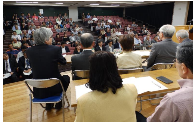
写真：ステージ側から客席

皆様のご指導・ご鞭撻を賜りますようお願い申し上げますとともに、将来につづく子供たちのために、地域発展のために尽力していくことをお誓い申し上げます。あいさつといたします。