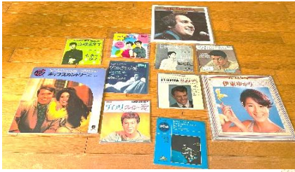
前半のレコードジャケット