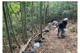
竹を伐採する作業