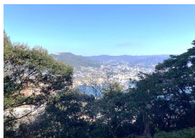
頂上から市内を見渡す風景

6月16日(日)午前8時80分~ 赤崎岳登山道整備を実施しました。 地域の皆様方に加えて、赤崎小学校・愛宕中学校両校の保護者も多数参加し、伐採や崩れかけた山道に土嚢を設置しました。