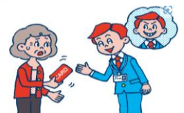
キャッシュカード詐欺盗