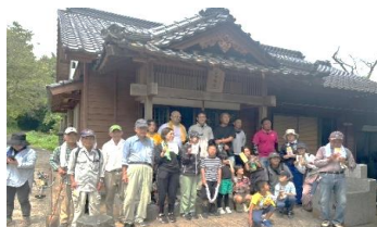
作業終了後に記念写真