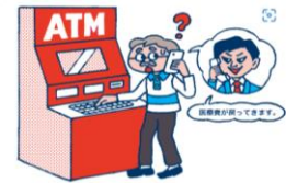
架空料金請求詐欺