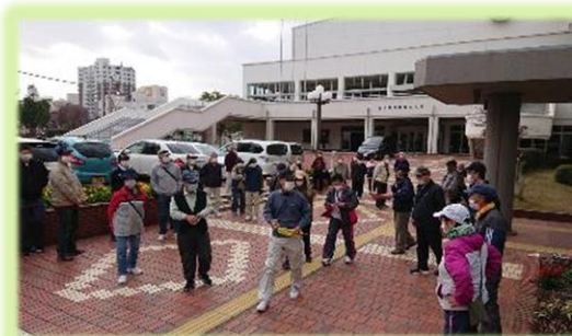
コミュニティセンターを出発