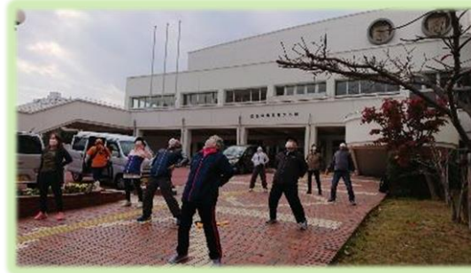
出発前のラジオ体操