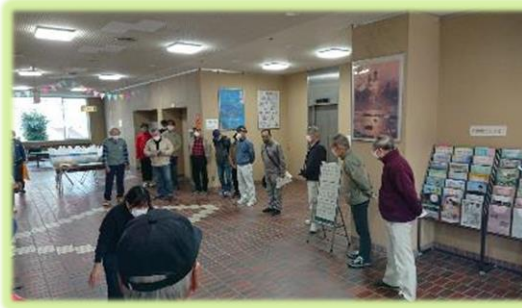
朝の挨拶と注意事項説明

令和4年12月11日(日)に短距離コースと長距離コースの2コースでウォーキング大会を開催しました。お天気に恵まれ、ほどよい寒さの中、35名の参加者の皆さんは元気に歩かれていました。