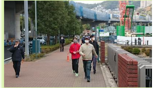
ニミツパークの外周を元気にウォーク