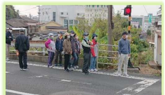
踏切でしばし足止め