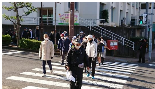
③ コミュニティセンターをスタート