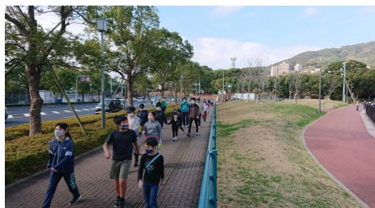
⑤ ニミツパークの外周