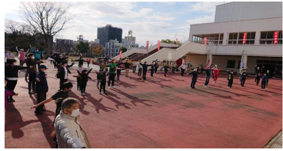
② ウォーミングアップのラジオ体操