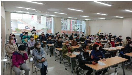
① 最初にコースの説明です。

だれ一人リタイアすることもなく、けがもなく無事に終了することができましたこと、参加者をはじめ関係者の方々に感謝とお劳いを申し上げます。