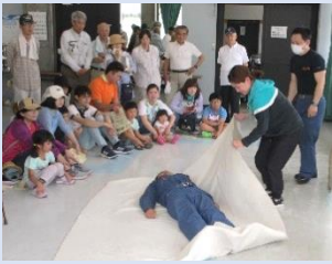
【応急担架作成及び緊急搬送訓練】