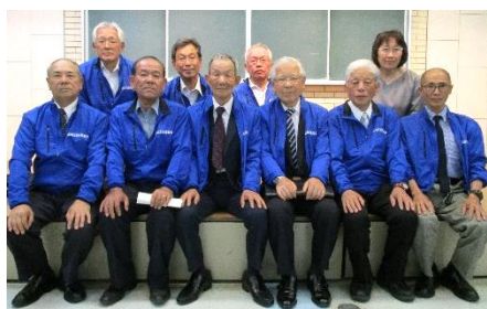
【令和元年度 北地区自治協議会役員の皆さん】