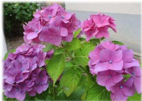
【北地区公民館の裏庭にて】