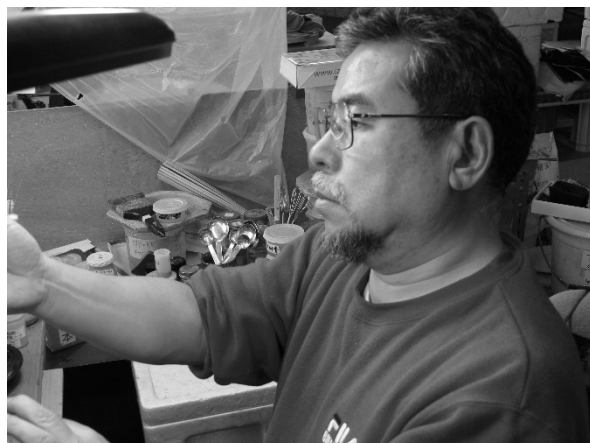
臥牛窯 (がぎゅうがま)

刷毛目の空間表現の中に草花や白鷺など しらさぎ を描きます。中でも白鷺は文字通り、路(みち)を開く鳥として開運の絵柄で全国的に人気があります。「白鷺文花瓶」は長崎県知事より 天皇皇后両陛下へ献上されました。