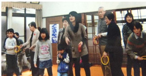
3世代交流の楽しい♥輪投げ大会

3世代交流として輪投げ大会、子供会は、クリスマス会や見学旅行、廃品回収など、高齢者は、食事支援や介護予防活動と、それぞれの年代でいろいろな活動をやって楽しんでいます。