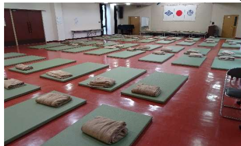
南地区公民館講堂の避難所 準備は自治協議会安全・安心部会長以下消防分団第11分団など地域の皆様のご協力を頂きました。