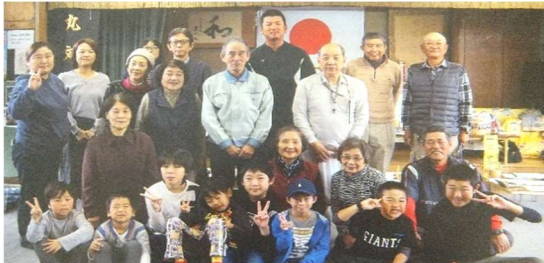
賞品いっぱいの輪投げ大会 皆さんがんばりました!!

3世代交流の輪投げ大会は、子供たちの参加でとても活気づきます。年4回の食事会や週一回の介護予防運動は、高齢者にとりとても楽しい時間です。