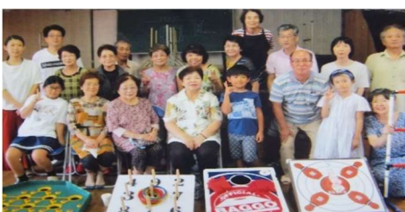
レクリエーションゲーム大会 各種ゲーム機がズラリ

年末以外に、春秋の2回19時から町内パトロールで防犯を呼びかけます。毎年恒例の、七夕やレクリエーションゲーム大会に参加して、また来たいと言ってもらえることが大変嬉しいことです。