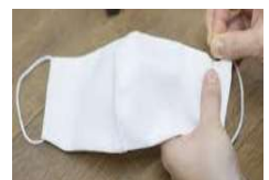
役員等による 手作りマスク 全世帯に配りました。

安全安心できる町づくりがいろいろなことへ繋がると考えています。町内の皆さんには、出来る事を、出来る時にやってもらえたらとても有難く嬉しいです。