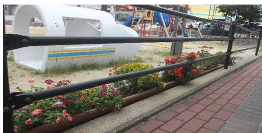
大宮公園の花々。町内で育てています。

大宮公園夏祭り盆踊り大会は地元で開催され、町民こそって参加して楽しめます。年4回の食事会や、そのあとのレクレーション、週1回の介護予防活動、子供会の年4回の廃品回収、市民大清掃など皆で積極的に取り組んでいます。