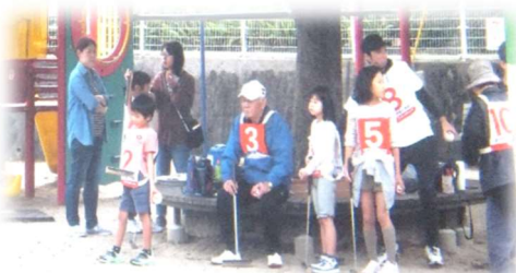
日水公園で 3世代交流のゲートボール大会 出番はまだかなあ！

三世代交流ゲートボール大会は41回を数え、子供から高齢者まで参加して楽しい時間です。町内には、若い世代家族も多く、町内行事にも協力的で、特に役員は高齢者が多いため、若い人の協力はとてもありがたいです。行事で皆さんと会えるのは楽しみであり、やりがいがあります。