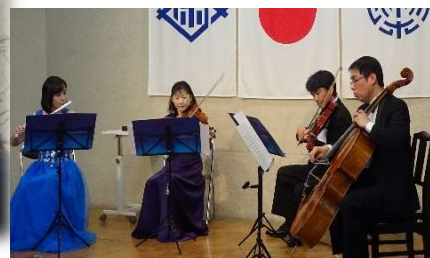
長崎 OMURA 室内合奏団