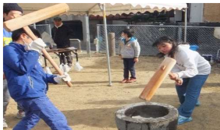
大人に混じり子どもたちも餅つき！ 大人顔負けの力を発揮します。

町内の夏祭りは、子供たちがみこしを担いで町内を回ります。夕方からは、公園でたくさんのお店やゲームで楽しみ、他の町内からも参加されとてもいいおまつりです。12月は餅つき。高齢者と子供たちが餅を丸め和気あいあいとした時間が流れます。これからも、若い人たちが参加できるような雰囲気を作りますので、行事の表方でも裏方でも、老若男女、多くの皆様にご参加頂けたら大変嬉しいです。