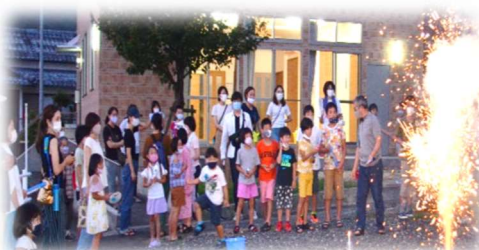
初めての花火大会 家族連れ大勢で楽しみました。

公民館は、新築以来、卓球、カラオケ、介護予防運動、話し合い会、料理実習、書道・そろばん教室など、多方面に利用されています。今年は、コロナ禍の下、恒例の夏祭りの代わりに花火大会を開催し多くの参加者に楽しんでもらえました。