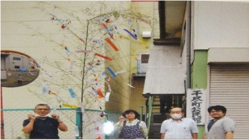
毎年恒例七夕まつりは、皆さんの楽しみです。

町内高齢者の皆さんとは、集まる機会を作るため、ぜんざい会、食事会、七夕会、市民大清掃等を実施して、広い町内の中での融和を図っています。