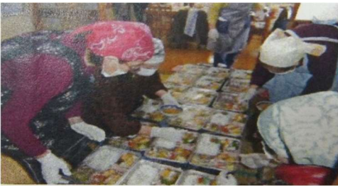
年3~4回婦人部による実施される高齢者への食事支援です。

役員は、「美しく安全で楽しいまちづくり」のために尽力し、役員以外でも、町内会活動に熱心に取り組んでくださる方が多くとても恵まれています。一方で、特定の方に頼り過ぎない業務分担の必要性も考えています。