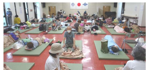
令和2年9月台風10号接近時の避難所

詳しくは、南地区コミセン、又は自治協事務局にお問い合わせください。(電話 コミセン 33-7144、事務局 55-4122)