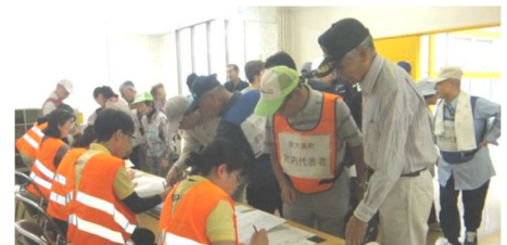
平成29年9月防災訓練時受付の様子