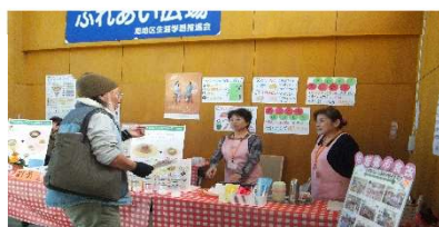
食の改善推進委員のブースでは、工夫を凝らした展示に立ち寄り質問する人も…