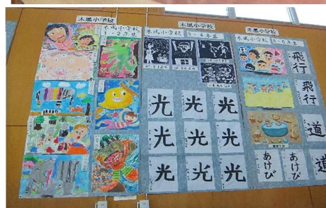
福石中、山澄中、福石小、木風小、天神小の皆さんの作品が展示されました。