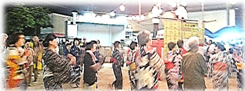
各町内から参加頂き、恒例の盆踊り 老若男女問わず夏の一夜、今年も盛り上がりました。

8月2日の会場設営から8月4日の撤収まで、沢山の皆様のご協力を頂き、誠にありがとうございました。