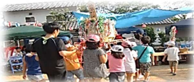
《おみこしで町内を周りました。》 藤原町1組「夏まつり」(8/5)

木風町、藤原町で町内の夏祭りが開催され、たくさんの参加者を得て、和やかで楽しいひとときとなりました。