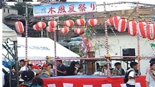
木風町2組「木風夏祭り」(7/21)

木風町、藤原町で町内の夏祭りが開催され、たくさんの参加者を得て、和やかで楽しいひとときとなりました。