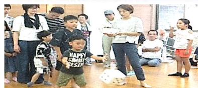
《親子でゲームを楽しみました。》 藤原町3組「夏まつり」(8/18)