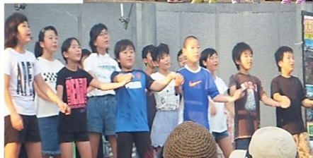
海光園と福石小の皆さん おどりがんばりました！ たくさんの応援うれしかったね☺