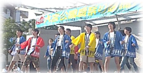
福石中の皆さんは、踊りの後、被災地の方々への募金をお願いしました。

4年前から、「夏まつり実行委員会」と「南地区自治協議会」の主催となり、今年も盛大に開催されました。