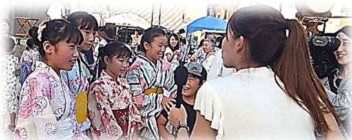
「ゆかたの君」 テレビ佐世保の インタビューで 何を聞かれたかな!!