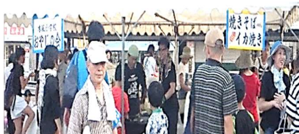
↑ 木風小おやじの会、福石中おやじの会 ↓ 皆さん頑張ってバザーお疲れ様でした!