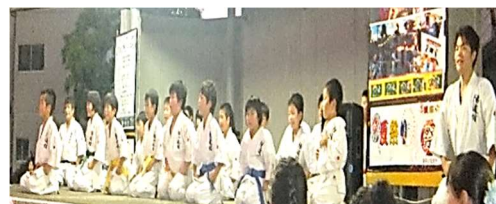
池山空手道場の力強い演武に みな、息をのみました!!