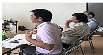
早良校区手っ早い隊の皆様