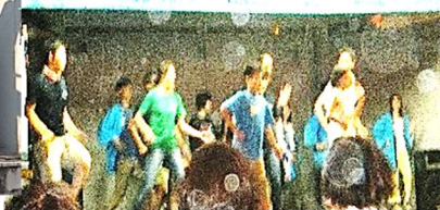
話題のダンシングヒーロー盆踊り ↑ 金融機関の皆さん みんなのお手本ありがとう👏