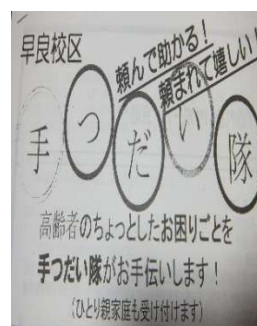
早良校区手っ早い隊資料

研修参加者からは、「てっだい隊の活動の形が明確に捉えられ、大変有意義な一日であった」等の感想が聞かれました。