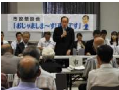
西地区市政懇談会の様子

7月31日(月)に「おじゃましま〜す! 市長です」でお馴染みの市政懇談会が、市長をはじめ関係部課長の出席のもと西地区公民館で開催され、佐世保市から移住・定住の促進、空家等対策、マイナンバー普及促進について説明がありました。