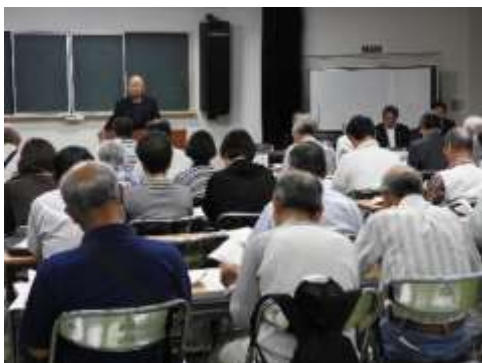
西地区自治協議会定期総会の様子

5月27日(土)午後1時から西地区公民館において29年度定期総会を開催しました。前年度の事業報告・決算報告のあと29年度事業計画案・規約改正案・細則の制定について審議され満場一致で原案が承認されました。