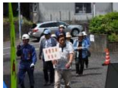
西地区防災訓練の様子

最後に非常食炊き出し訓練で作られたカレーライスを参加者全員でいただき、大変有意義な一日となりました。