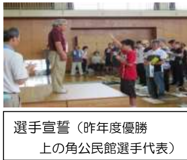
選手宣誓（昨年度優勝 上の角公民館選手代表）