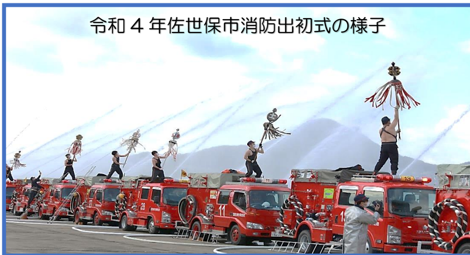
令和4年佐世保市消防出初式の様子

地域を守る「義勇」と「郷土愛」に満ちた消防団は、住民に身近でとても頼もしい存在です。