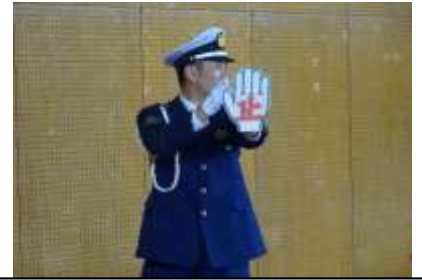
「手のひら」で横断の意思をドライバーに伝えましょう！

今年度、大野地区は佐世保警察署の「高齢社会総合対策重点推進地区」に指定されています。みなさん詐欺にあわないよう十分注意しましょうね！ 気になる電話があったら、家族や警察に相談しましょう。