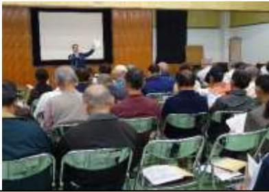
夜道では反射材を身につけて！