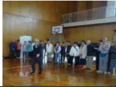
飲酒時は普段どおりに歩けません