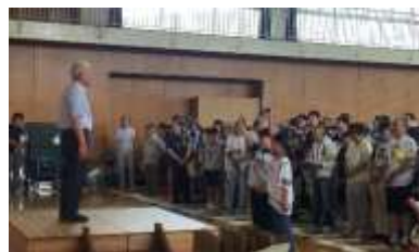
選手宣誓（昨年度優勝 坂の上公民館選手）