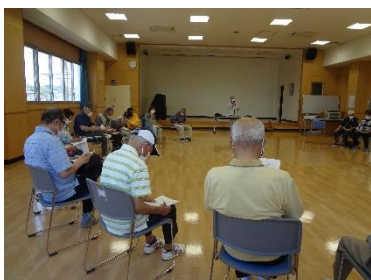
《ことわざドリル～考え中》

令和6年6月13日(木)は、「ことわざドリル」と100歳体操を行いました。当日は、男性8名、女性22名、計30名のみなさんが参加されました。「石の上にも100年」や「口の行水」など、参加者は記憶をたよりにたくさんのことわざを思い出していました。