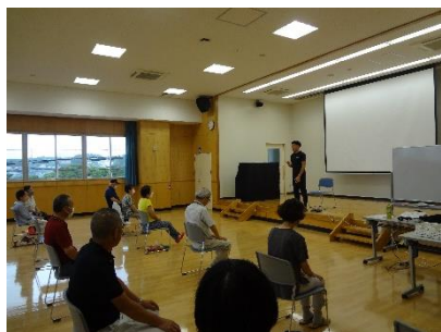
《脳トレストレッチ体操の様子》

令和6年7月11日（木）は、「脳トレストレッチ体操」と100歳体操を行いました。当日は、男性5名、女性32名、計37名のみなさんが参加されました。“脳トレ”や“手足の運動”など先生の掛け声に合わせて、大きな声で応える参加者のみなさん。水分補給の大切さもお話しされました。